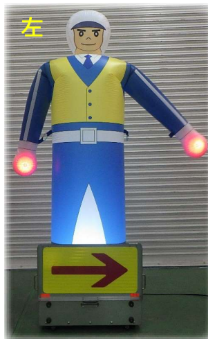
走行車線規制時に