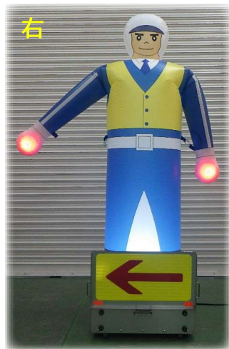
追越車線規制時に

● バルーンが膨らむ [BLOW][MOVE]の切替スイッチで、固定と腕振りを選べます。(合計6パターン 約10秒で起立 腕振り 約40回/min)