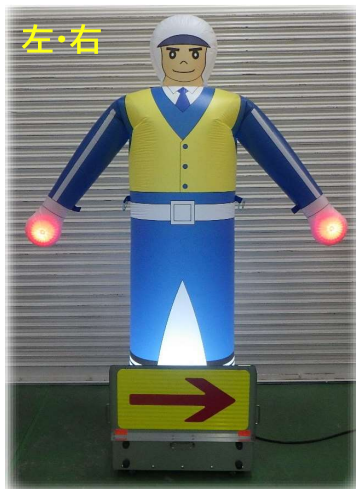
島状規制時や後尾警戒等の注意喚起に