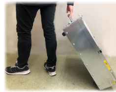
運搬用のグリップと移動用キャスター付き 一人で移動させることが出来ます。