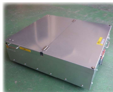
収納寸法:H215×D653×W605 積み重ねて収納も出来ます。